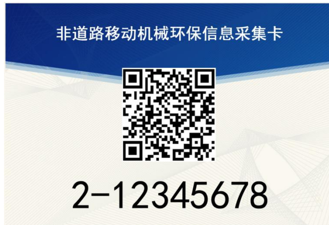
图 2 采集卡正面样式