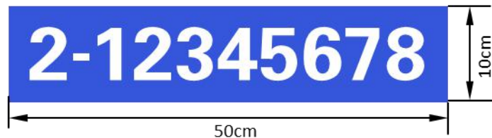
图 1 非道路移动机械环保标牌样式